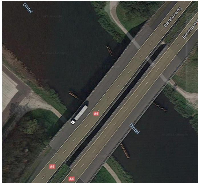
De A4 over de Dintel

Het gebruik van de vluchtstrook is vergelijkbaar met de situatie op de Haringvlietbrug en de situatie bij Roosendaal-West over de Nieuwe Roosendaalsche Vliet (zie foto's hieronder).