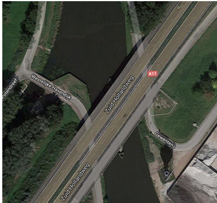
A17 over de Nieuwe Roosendaalsche Vliet; rechts parallelweg

Wij denken dat deze oplossing tegen relatief lage kosten verwezenlijkt zou kunnen worden.