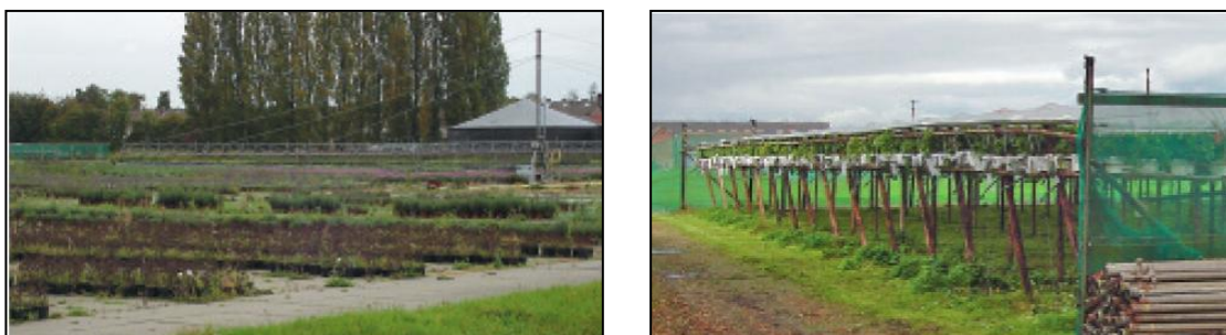
Verschillende vormen van permanente teeltondersteunende voorzieningen.