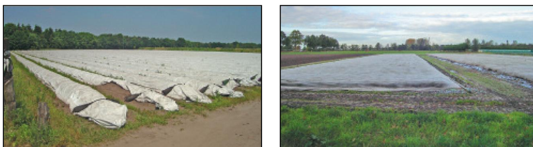
Verschillende vormen van tijdelijke teeltondersteunende voorzieningen.

Naast permanente voorzieningen bestaan er ook tijdelijke teeltondersteunende voorzieningen (o.a. folies, insectengaas, acryldoek, wandelkappen, schaduwhallen, hagelnetten). Onder tijdelijk wordt verstaan dat deze voorzieningen op dezelfde locatie gebruikt kunnen worden zo lang de teelt dit vereist, met een maximum van circa 6 maanden.