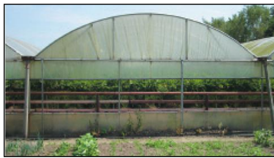
Verschillende vormen van teeltondersteunende kassen.