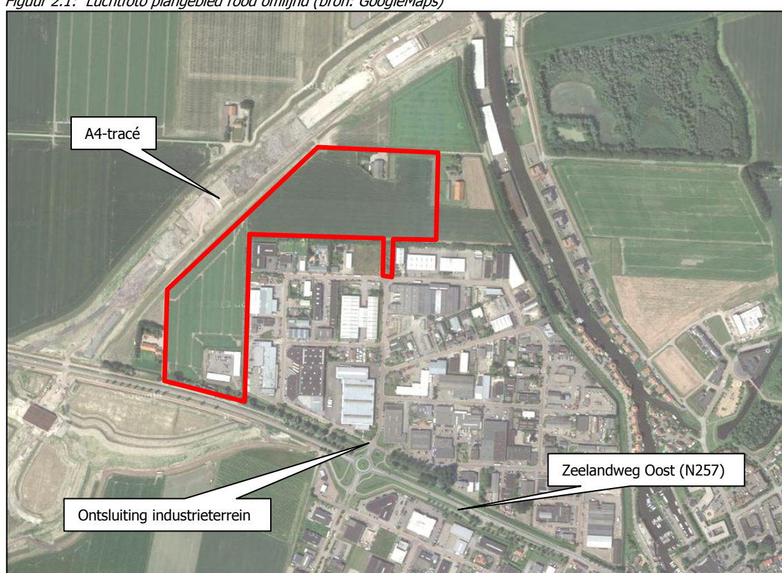
Figuur 2.1: Luchtfoto plangebied rood omlijnd

De ontwikkeling betreft het realiseren van de uitbreiding van het industrieterrein Reinierpolder te Steenbergen. De uitbreiding wordt gevonden aan de noordwest-zijde van de Reinierpolder I, ten zuidoosten van de nieuwe A4. De ontsluiting vindt plaats via het bestaande industrieterrein. Figuur 2.1 toont de situering van het plangebied.