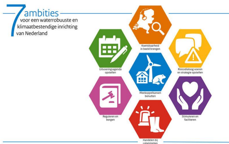
Figuur 1: Tussendoelen DPRA.

Deze tussendoelen van het DPRA zijn opgenomen in figuur 1. In figuur 2 volgt de planning van deze stappen.