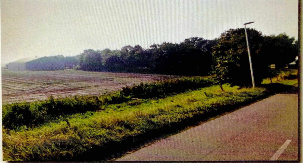
Afbeelding 4. AANGEZICHT PLANGEBIED KLADDE (NOORD)