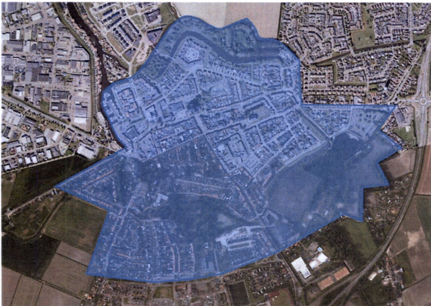
Plangebied Vitale Vesting

In december heeft u als raad aan de wethouder gevraagd om informatie te verstrekken aan inwoners van de gemeente Steenbergen die wonen in het gebied dat de Vitale Vesting beslaat en waar veranderingen gaan plaatsvinden.